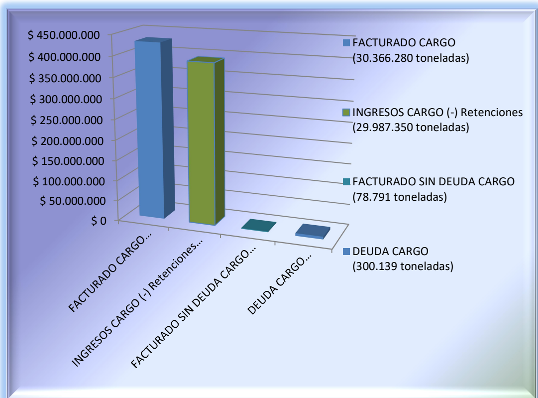
GRAFICO I: FACTURACION CARGO