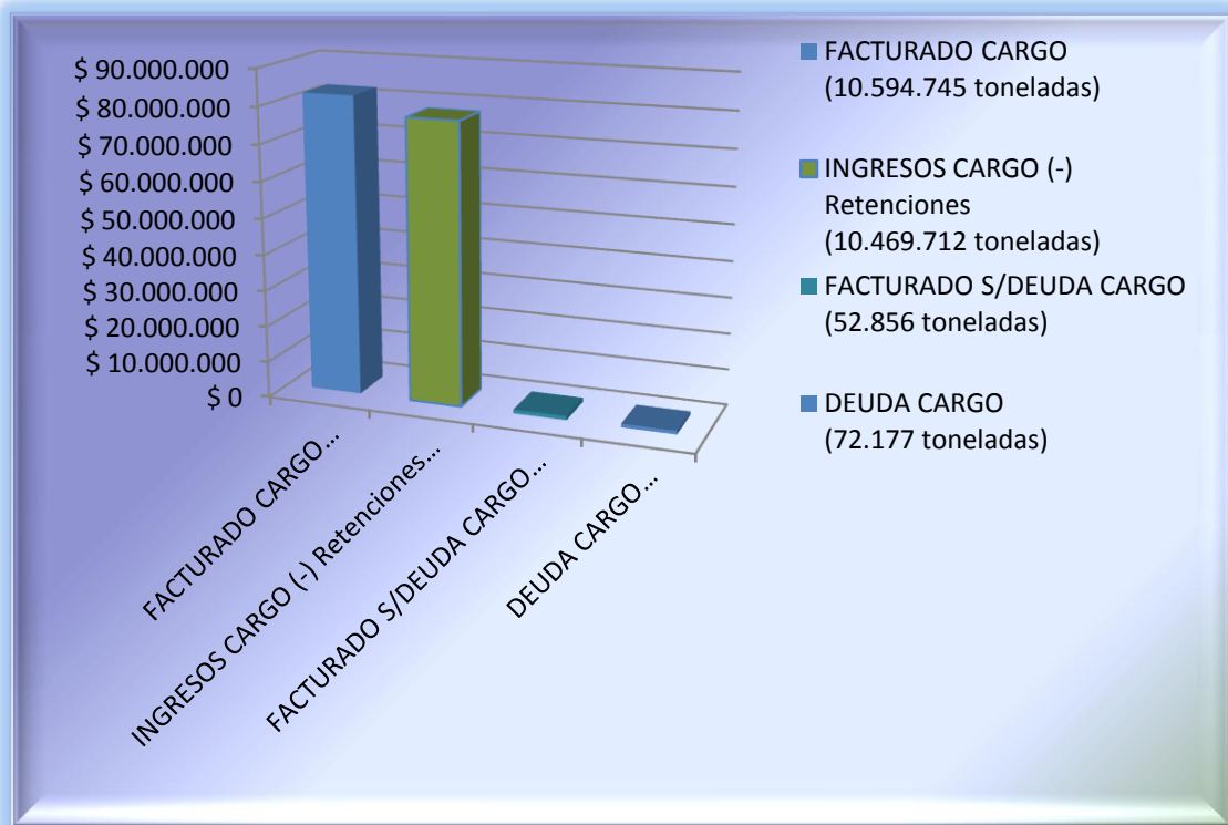
GRAFICO I: FACTURACION CARGO