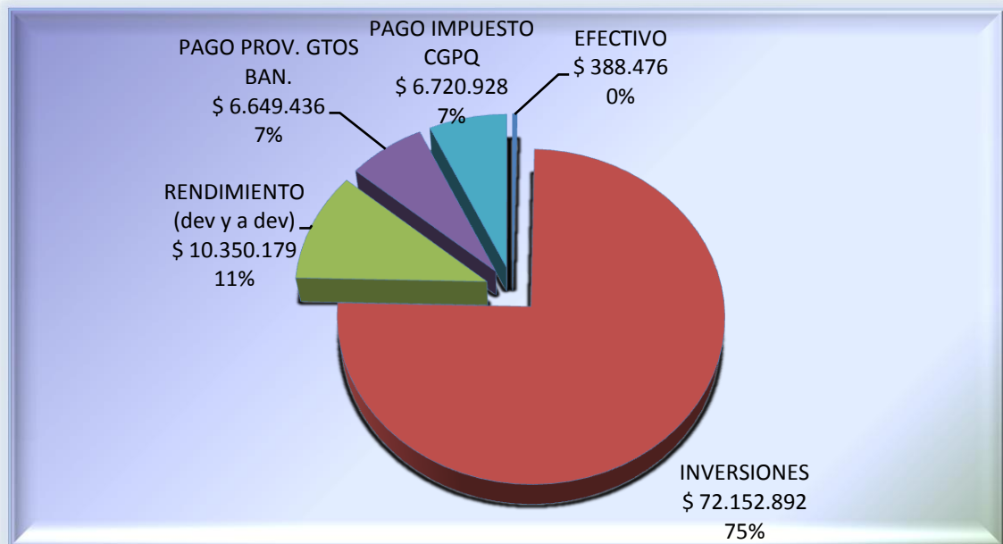
GRAFICO II: MOVIMIENTO DE INGRESOS Y RENDIMIENTO