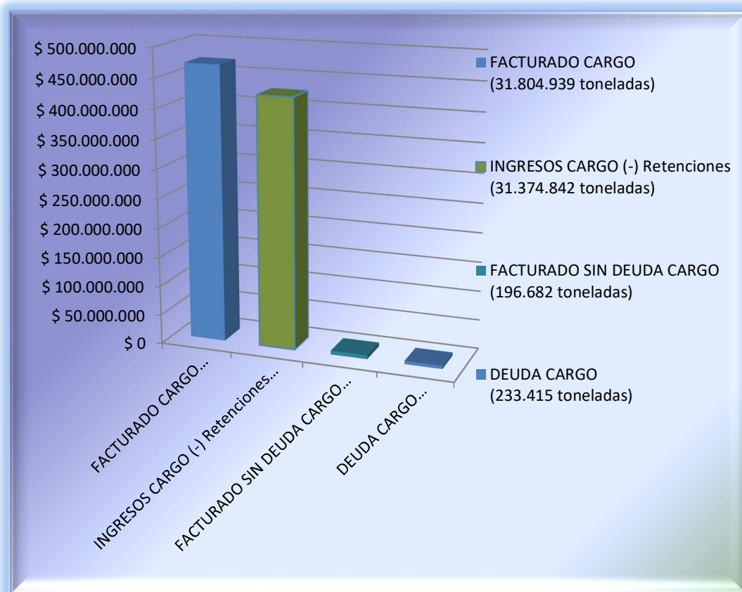
GRAFICO I: FACTURACION CARGO